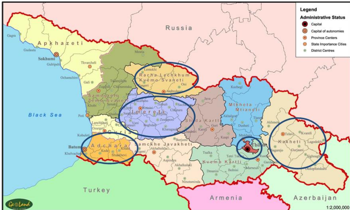
სურათი 1. საქართველოს ადმინისტრაციული რუკა, სადაც მითითებულია შესაძლებლობების შეფასების განხორციელების (10-21 მარტი, 2014) რეგიონები: თბილისი (დედაქალაქი, ცენტრალური და მუნიციპალური დონეები); გურჯაანი, თელავი, ყვარელი (კახეთის რეგიონი); ქუთაისი (იმერეთის რეგიონი); ამბროლაური (რაჭა-ლეჩხუმი- ქვემო-სვანეთის რეგიონი); ბათუმი (აჭარის ავტონომიური რესპუბლიკა).

კატასტროფის რისკის შემცირების შესაძლებლობების შეფასების ანგარიშისთვის მზადება - წინამდებარე ანგარიში შეფასების ჯგუფის წევრებმა წარმოდგენილი მონაცემების საფუძველზე მოამზადეს. დამატებითი მონაცემებისა და კომენტარების მისაღებად ანგარიში წარედგინათ შეფასების პროცესში მონაწილე ადგილობრივ დაინტერესებულ მხარეებს. საბოლოო ანგარიშის დასამტკიცებლად ტარდება ეროვნული სემინარი. ანგარიშში წარმოდგენილი რეკომენდაციები საფუძველს შექმნის ეროვნული სამოქმედო გეგმის შემუშავებას.